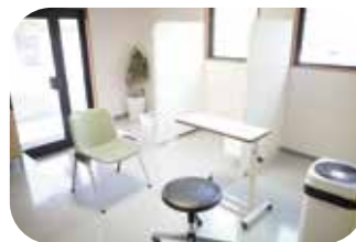
発熱外来用の診察室

最近の新型コロナウイルス感染拡大に伴い、当院も岐阜県発熱外来診療・検査医療機関の指定を受けました。以前より通常の診察室とは別に発熱外来を設置しており(入り口も別々です)、発熱のない患者様も安心して受診していただけます。