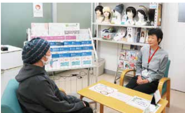
がんほっとサロン

緩和ケアセンターでは、「診断された時からの緩和ケア」を掲げて、「生活のしやすさ質問票」を用いて、患者さんのスクリーニングを行い、緩和ケアチームによる回診、カンファランス、緩和ケア外来、看護外来を通じて、がん患者さんのあらゆる苦痛を緩和し、適切な医療を受けられるようにサポートしています。