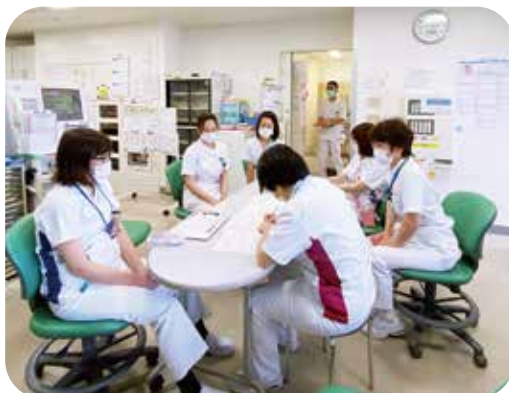
在宅療養報告書を用いたケースカンファレンス

患者さんやご家族の思いが記載されているときは、特に受け持ち看護師にとっての励みになっています。これからも地域の皆様から頂いた情報を病棟で共有しながら次の退院支援に活かしていきます。