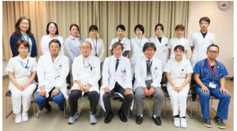
がん医療センター関係者

「がん医療」は岐阜県総合医療センターの重点医療の1つであり、当センターは2008年以來、地域がん診療連携拠点病院に指定されています。がん医療センターは、がん拠点病院に求められる様々な機能を整備し、実践していくために、横断的に活動している部署です。緩和ケアセンター、化学療法部、がん相談支援センター、がん登録室から構成され、カンサーボード、がん患者サロンの運営も行っています。