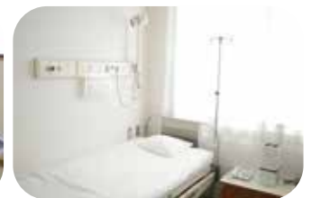
発熱患者の点滴に使用しているベッド