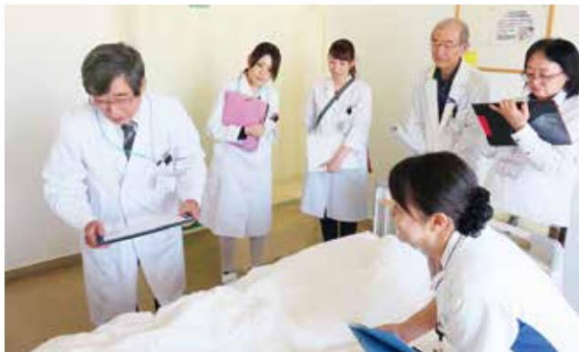
緩和ケアチーム回診