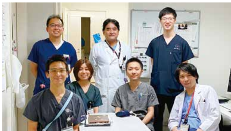
胎児診療科メンバー

胎児ドック、羊水検査も新型コロナ感染の可能性がある場合には県内、県外でもお受けしておりません。受診希望がある場合には一定期間の健康観察表の記入の上で( https://www.gifu-hp.jp/COVID-19_pregnancy/ )、まずは外来初診の予約をお願いします。