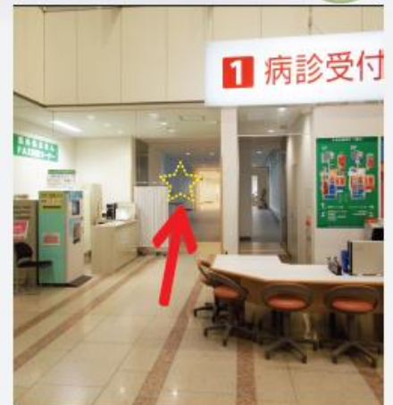
ほっとサロンの場所